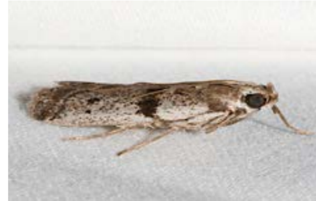
POLILLA MEDITERRÁNEA DE LA HARINA EPHESTIA KUEHNIELLA

Orden: Lepidóptera Familia: Pyralidae Especie: Ephestia (Anagosta) kuehniella(Zeller)