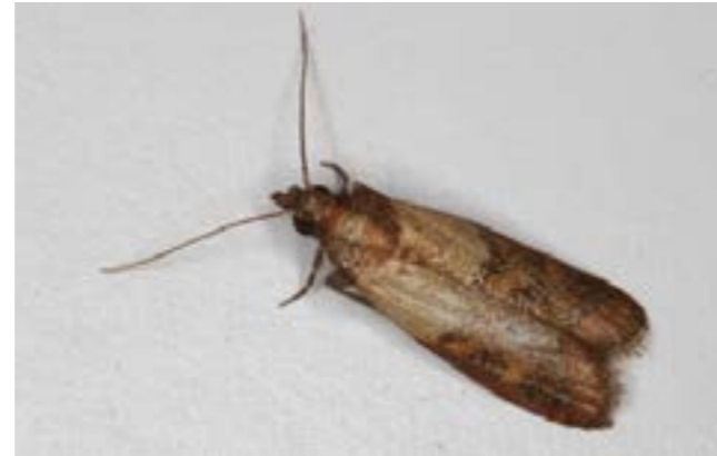
POLILLA GRIS DE LA HARINA PLODIA INTERPUNCTELLA