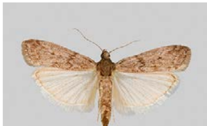
POLILLA INDIA DE LA HARINA/FRUTA ANAGASTA KUEHNIELLA