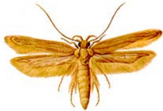
POLILLA DORADA DE LOS CEREALES SITOTROGA PELIONELLA