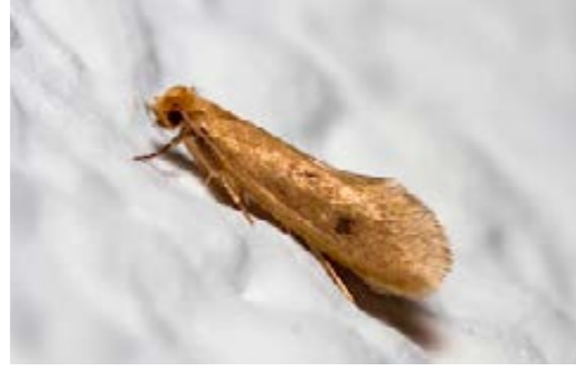
POLILLA DE LA ROPA TINEOLA PELLIONELLA