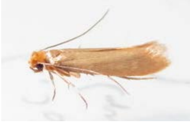
POLILLA DE ROPA TINEOLA BISELLIELLA